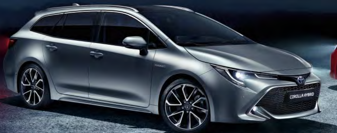
Corolla Touring Sports

On valintasi sitten urheilullinen ja dynaaminen Corolla Hatchback, monipuolinen ja luokkaa suuremmaksi kasvanut Corolla Touring Sports, tai ylellinen Corolla Sedan, nyt on tullut aika valita uusi Corolla Hybrid.